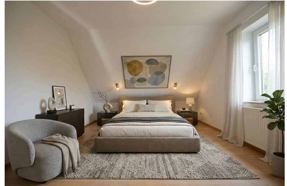
Schlaf- und Kinderzimmer (li.original,re.digital eingerichtet)