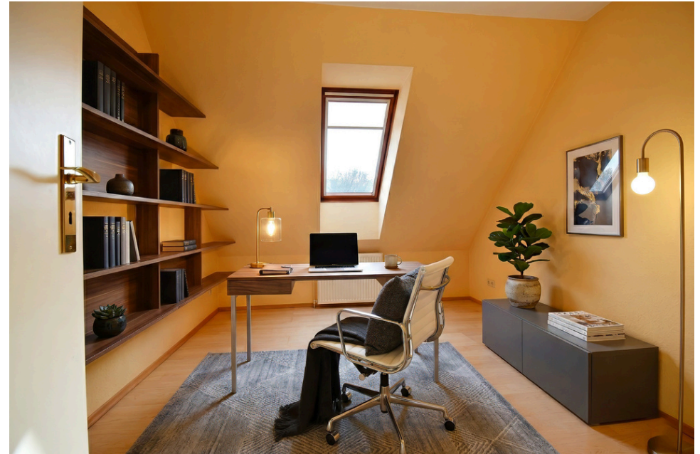
Arbeitszimmer (li.original,re.digital eingerichtet)