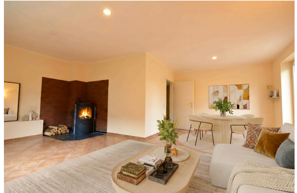
Wohn-Esszimmer (li.original,re.digital eingerichtet)