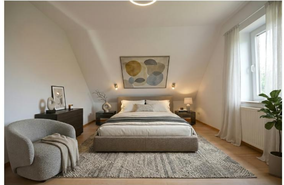
Schlaf- und Kinderzimmer (li.original,re.digital eingerichtet)