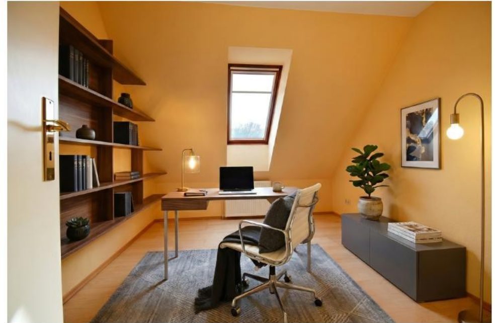
Arbeitszimmer (li.original,re.digital eingerichtet)