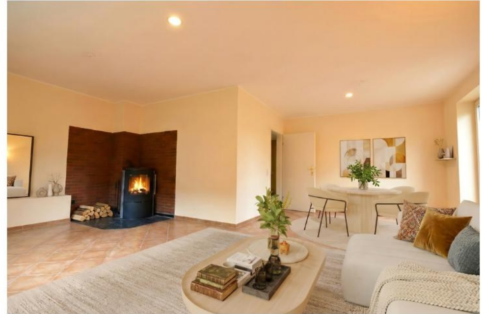
Wohn-Esszimmer (li.original,re.digital eingerichtet)